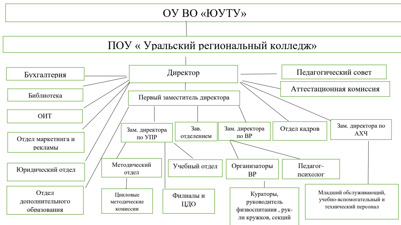
Рисунок 1 – Структура ПОУ «УРК»

Организационная структура Колледжа соответствует уставным требованиям и обеспечивает гибкость и оперативность выполнения основных функций и задач учебного заведения.